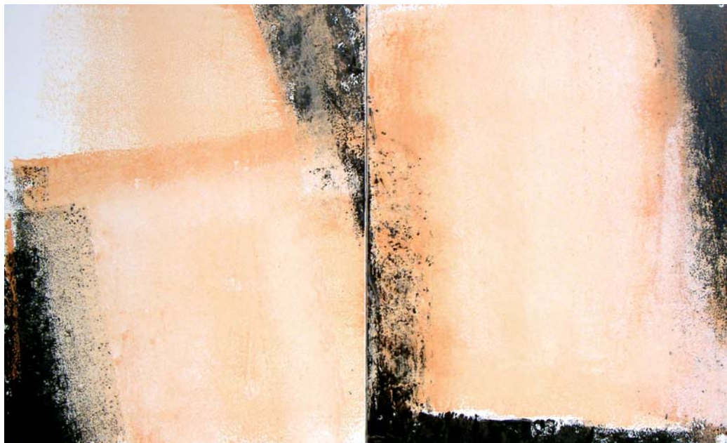
2x15F n°2 – 2006