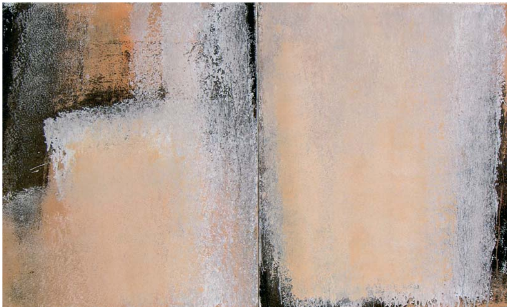
2x15F n°1 – 2006