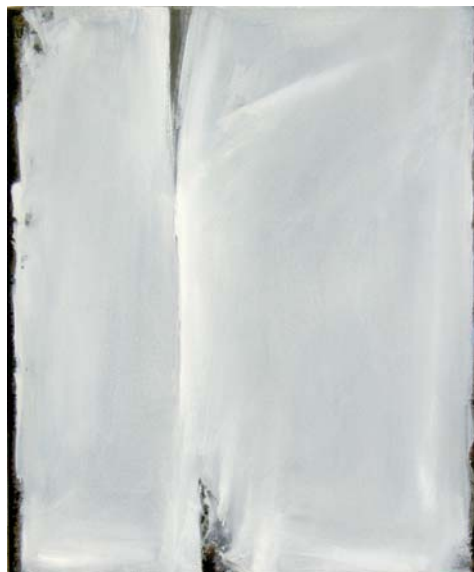
15F n°2 – 2006