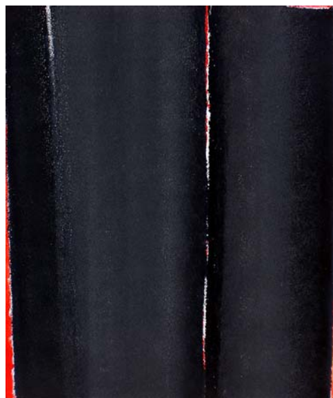
15F n°5 – 2006

Technique mixte sur 2 toiles jointes par plaque de fer vissée au dos (65 x 108 cm)