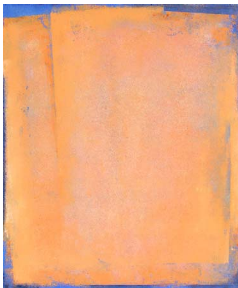
15F n°6 – 2006