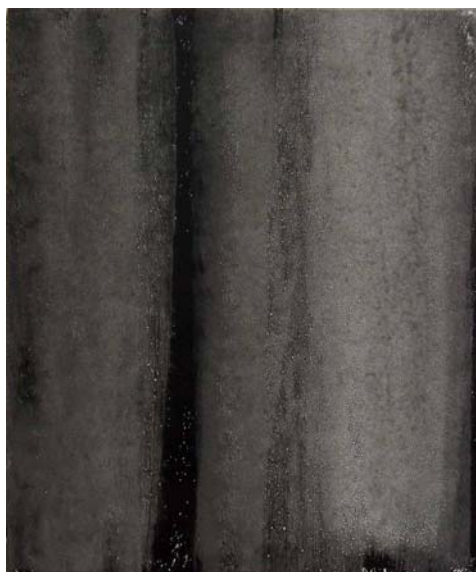
15F n°3 – 2005

Technique mixte sur 2 toiles jointes par plaque de fer vissée au dos (65 x 108 cm)